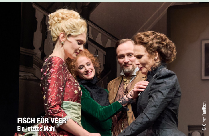
FISCH FÖR VEER Ein letztes Mahl