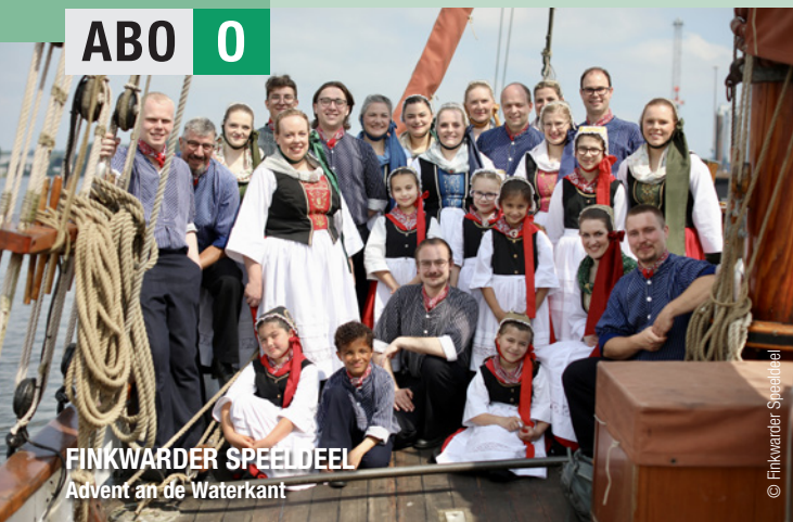
FINKWARDER SPEELDEEL Advent an de Waterkant